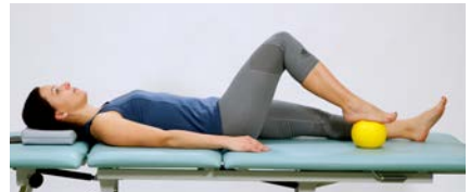
Variante: mit kleinem Ball rollen