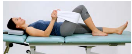
Kniebeugung mit Handtuchunterstützung